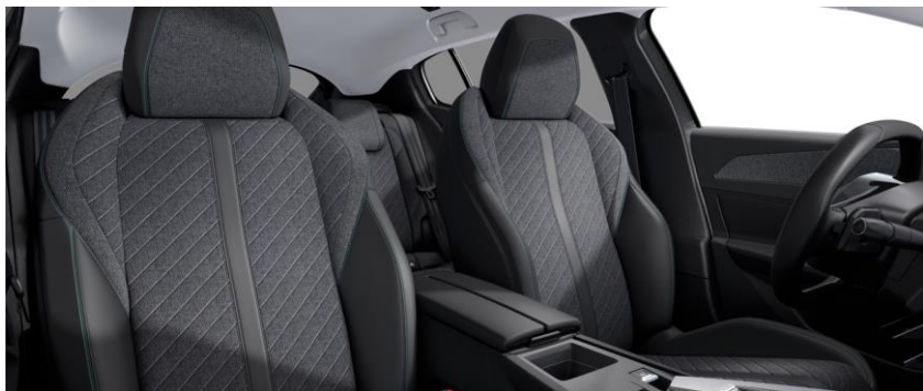
ALLURE - poťah FRACTIL (U3FX)