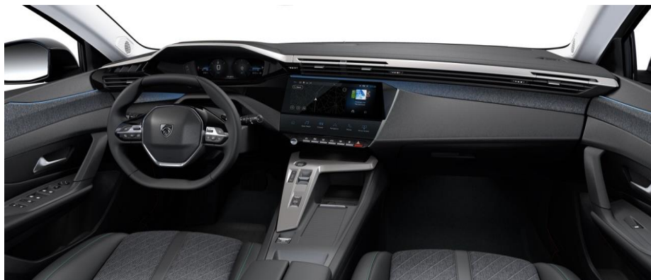
ALLURE - palubná doska s dekorom TEXA