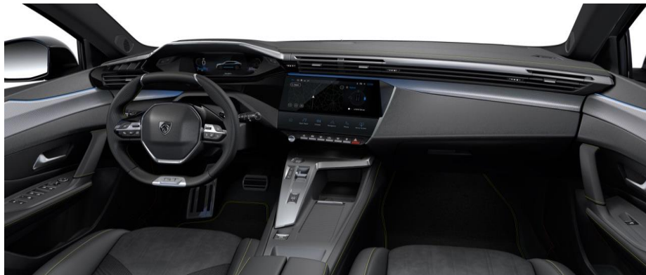
GT - palubná doska s chrómovým dekorom a zeleným prešívaním